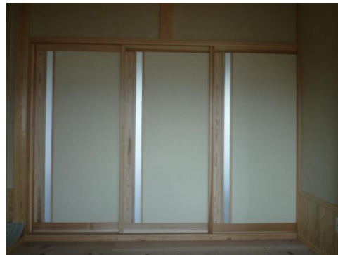
2F 和・洋の仕切りの戸襖です。 片側に、杉板をいれて細長い 明かりをとりました。