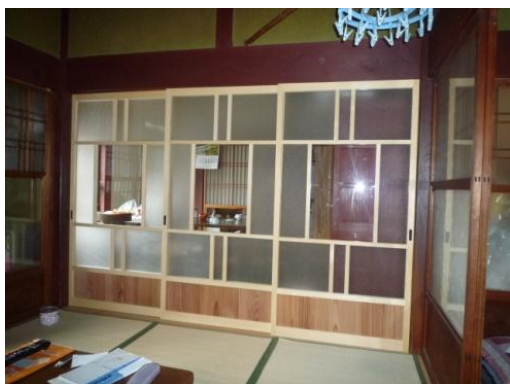
レトロ調の建具です 真ん中は、透明のガラスを入れました。