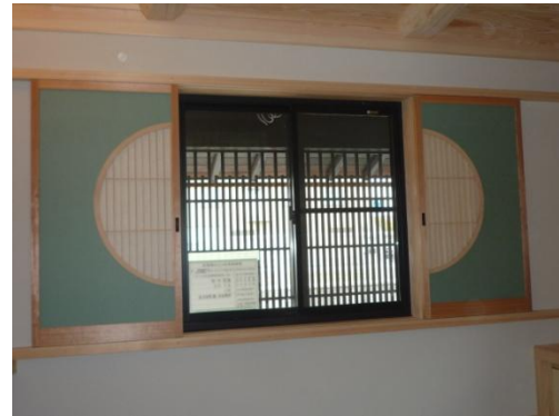
2本の引き分けの障子で窓が全開できます。v