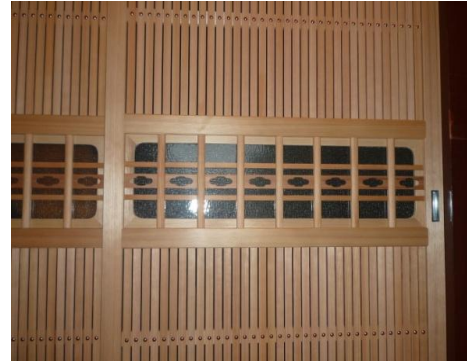
格子のすきまは3mmで、正面からかざり釘を打ちました。