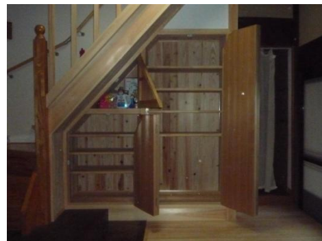
三角の開き戸と台形の折れ戸です。