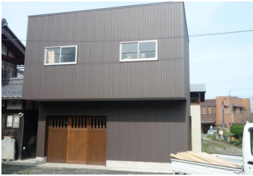
小屋の建具です！3本の引き寄せで、全開すると、開口が3mあります。