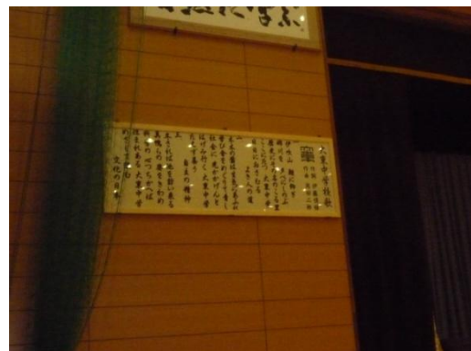
中学校の体育館に、校歌の額をつくらせてもらいました。