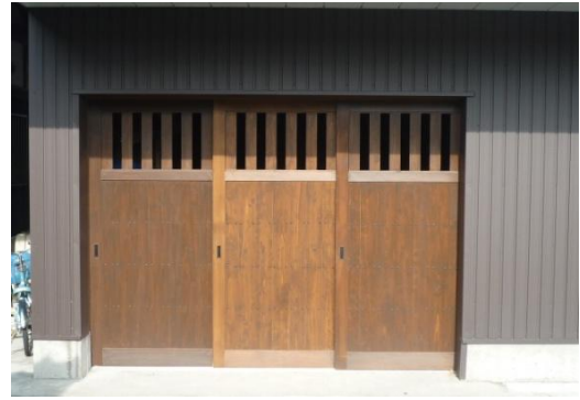
上部は、開閉できる無双窓をつけました。空気を通します。