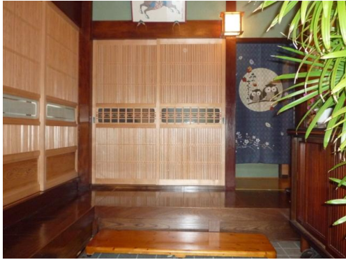
玄関正面の連子障子です。昔ながらの形で、どっしりしておちつきがあります。