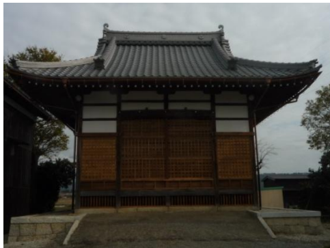
神社の神輿堂です。 柿渋を塗りました。